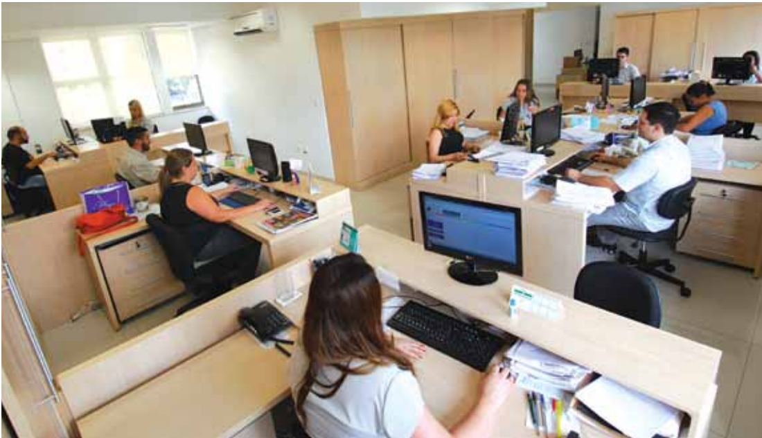
Equipe da Amagis Saúde na sede da Associação, em Belo Horizonte

A boa adesão à Amagis Saúde Grupo de Estados, de 417 associados, totalizando cerca de 1.600 pessoas, incluindo familiares e agregados, em um mês e meio da homologação do novo plano pela Agência Nacional de Saúde Suplementar (ANS), no dia 10 de abril,